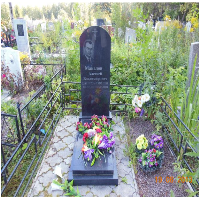
10. Представитель Министерства Обороны РФ

Представитель органа местного самоуправления