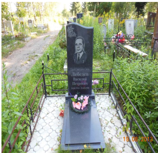
10. Представитель Министерства Обороны РФ

Представитель органа местного самоуправления