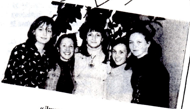
«Джазовый дивертисмент», 11 кл. Зал замолкает, когда эти потрясающие девушки выходят на сцену. А когда они начинают танцевать!...