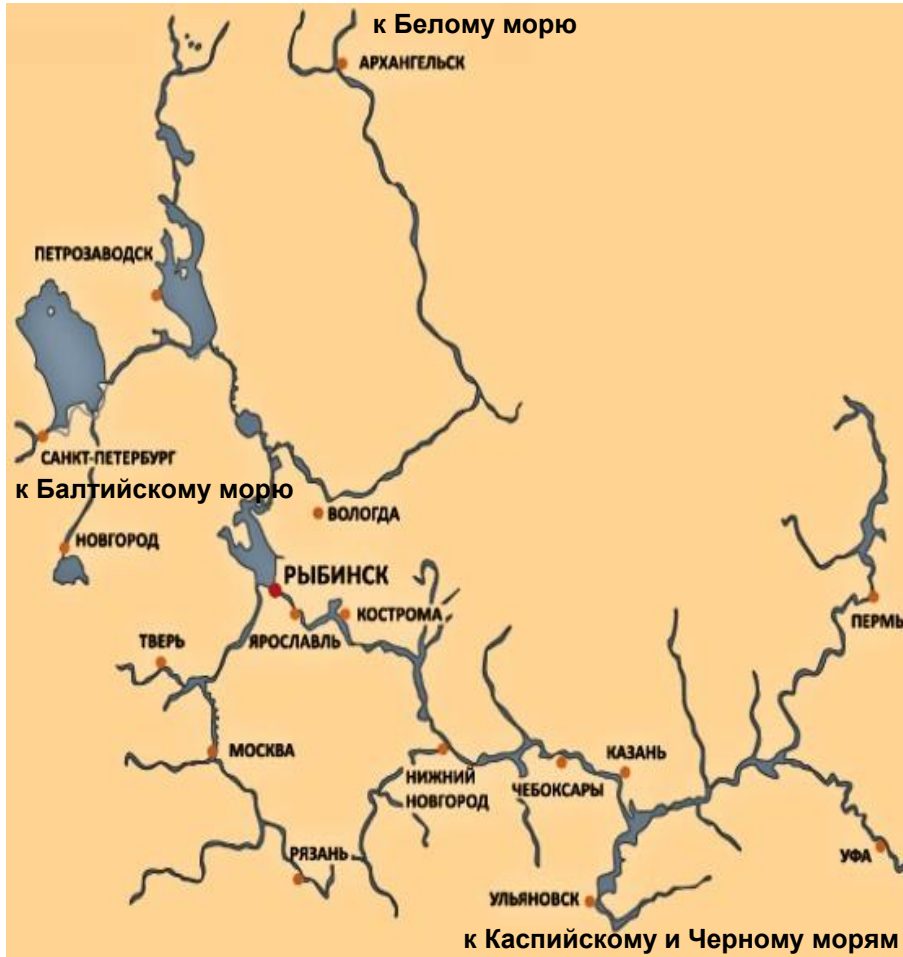
Схема водных путей

р. Волга: водные пути до Москвы, Санкт-Петербурга, Петрозаводска, Архангельска и др.