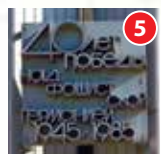
Обелиск в честь 40-летия Победы в Великой Отечественной войне Бульвар Победы