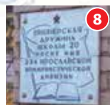
Мемориальная доска в память 234-й Ярославской коммунистической дивизии ул. Полиграфская, д. 5