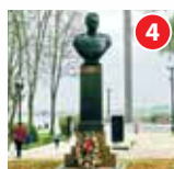
Памятник дважды Герою Советского Союза П. И. Батову Волжский парк