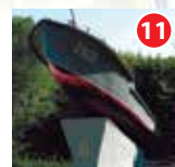
Мемориальный комплекс в память судостроителей ул. Зои Космодемьянской