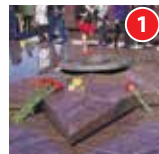
Мемориал «Огонь Славы» Волжский парк

✚ Адреса эвакогоспиталей военного времени