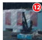
Мемориал в память о погибших судостроителях завода им. Володарского ул. Пятилетки