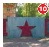
Мемориальный комплекс в память полиграфистов ул. Луговая