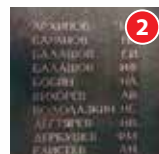
Стелы с именами рыбинцев — Героев Советского Союза Волжский парк