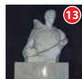
Памятник погибшим воинам пр. 50 лет Октября (микрорайон Переборы)