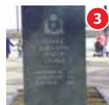
Стела с именами рыбинцев — полных кавалеров Ордена Славы Волжский парк