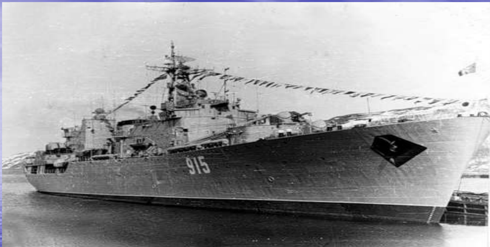
В честь И.А. Колышкина названа плавбаза подводных лодок проекта 1886